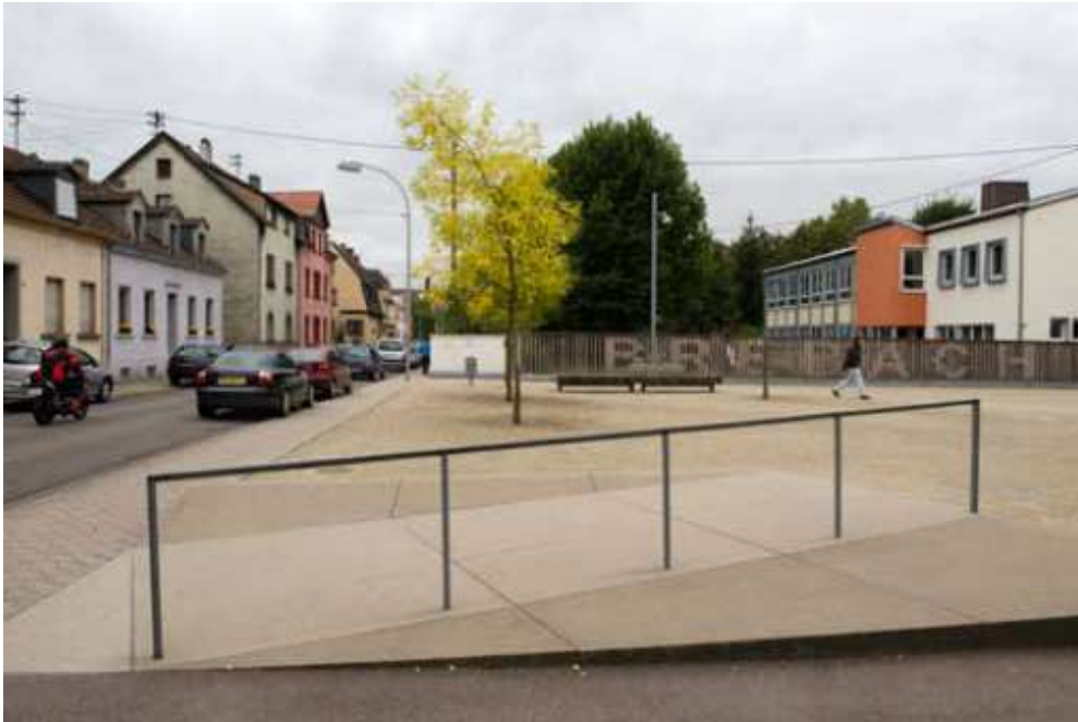
01__In Saarbrücken-Brebach wurde das Umfeld der Pfarrkirche Maria Hilf zu einem zentralen Platz umgestaltet.