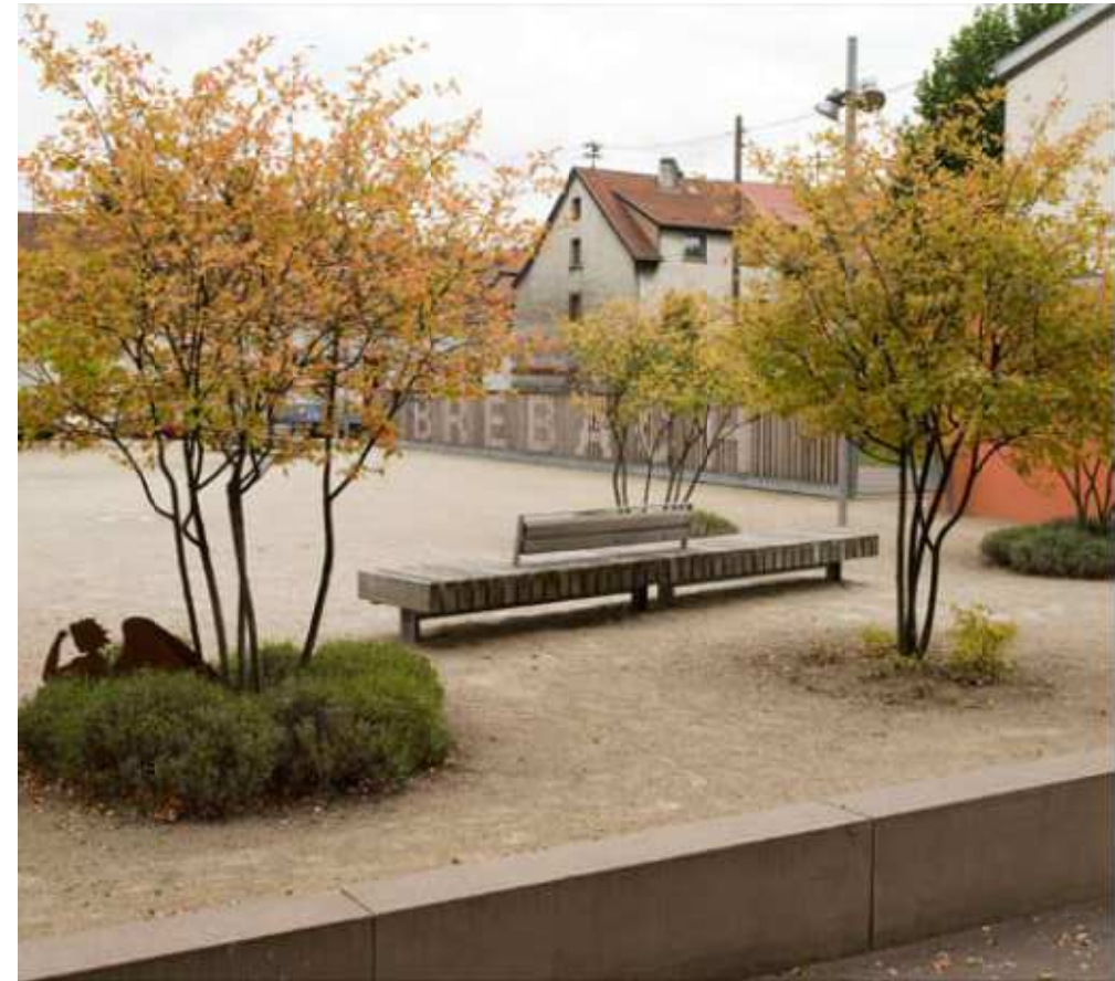
05__Der aus Lärche gefertigte Zaun mit dem Schriftzug „Brebach“ stärkt die Identifikation der Bewohner mit ihrem Stadtteil.