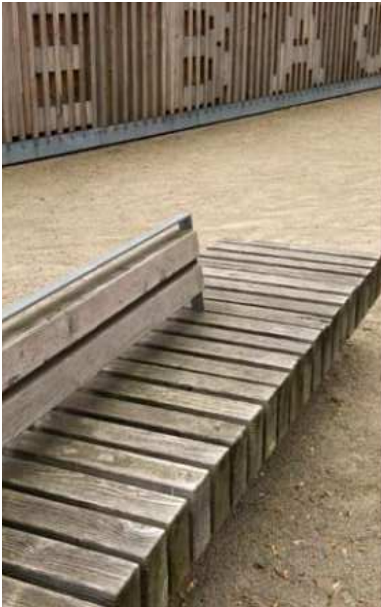
04__Platz für Kommunikation und Aufenthalt.