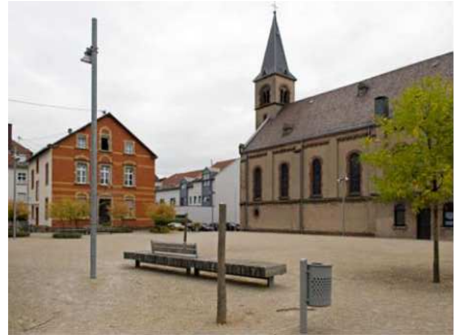
03__Durch die Verwendung robuster Materialien nimmt der Platz als Ort der Ruhe und Gelassenheit, aber auch als städtische Bühne verschiedene Charaktere an.